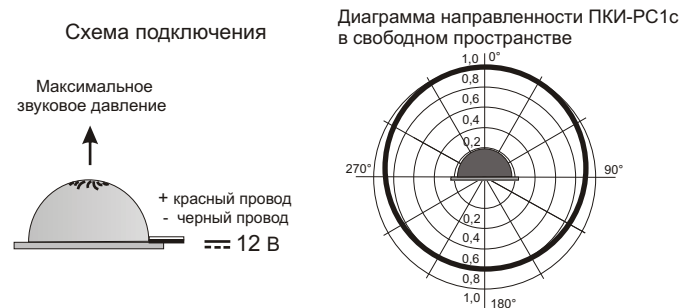
Рис.2 Схема подключения и диаграмма направленности звука оповещателя ПКИ-РС1с.

5.2. На рис.2 показана схема подключения и диаграмма направленности звука оповещателя ПКИ-РС1с.