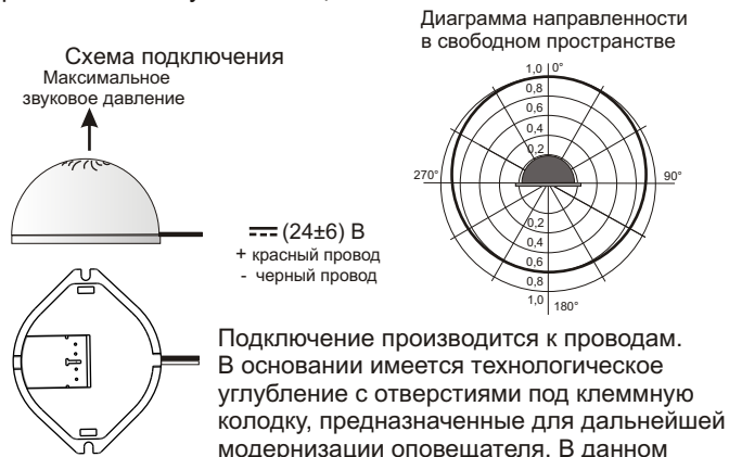
Рис.2 Схема подключения и диаграмма направленности оповещателя.

5.3. На рис.2 показана схема подключения и диаграмма направленности звука оповещателя.